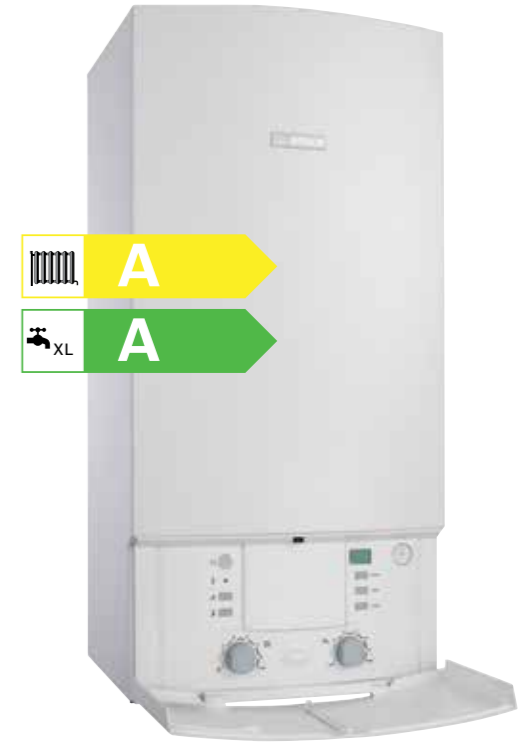
Comfort Condense Yoğuşmalı Kombi